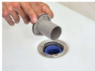
6 Es empfiehlt sich die Dicht- ringe für einen einfacheren Zusammenbau mit Seife zu schmieren.