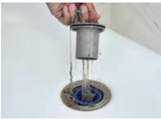
2 Sifoniereinsatz am Bügel herausziehen