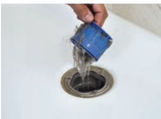
3 Sifontrennwand herausziehen