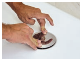
9 Sifonabdeckung einsetzen