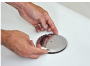
1 Sifonabdeckung entfernen