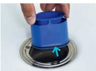
5 Sifontrennwand mit Dichtring nach unten einfügen.