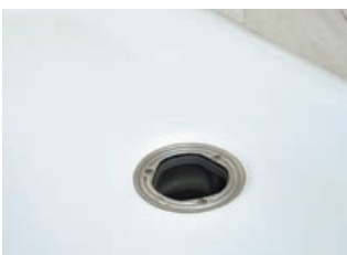
4 Reinigen mit Brause