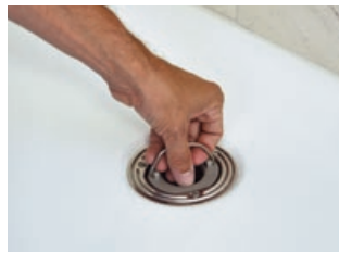
7 Sifoniereinsatz einsetzen